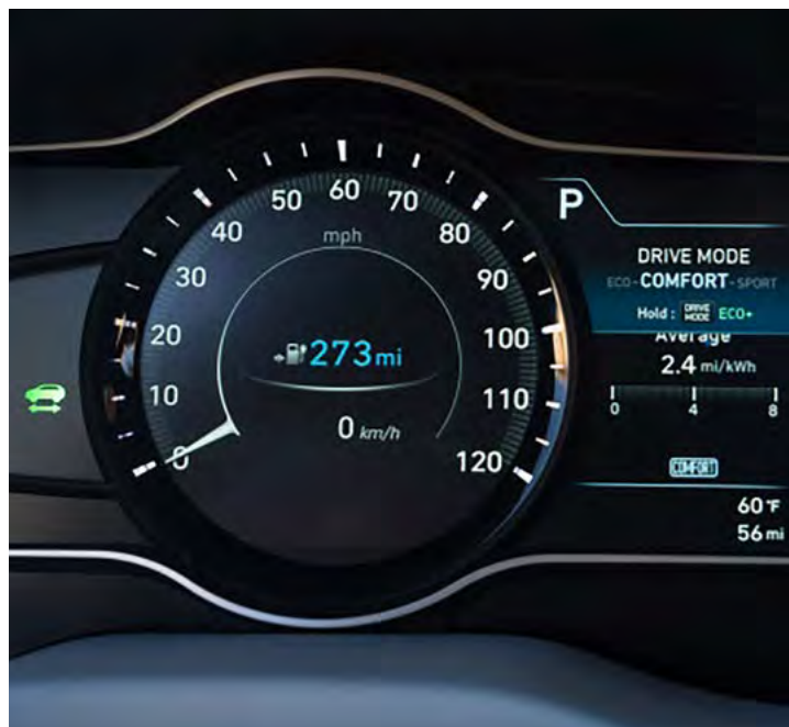
右图:现代MOBIS采用GL Studio开发Kona电动车仪表盘